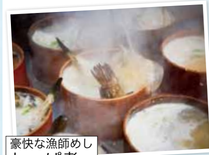
豪快な漁師めし わっぱ煮

【釜谷地区宿泊の場合】朝食をわっぱ煮に変更できます。ご希望のお客様は宿泊施設確定後に各自様で施設へお申しください。(別途追加料金 1,100 円) ※施設の都合や荒天の場合は通常の朝食となります。