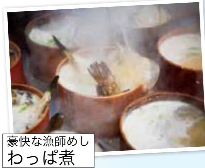
豪快な漁師めし わっば煮

【釜谷地区宿泊の場合】朝食をわっば煮に変更できます。ご希望のお客様は宿泊施設確定後に各自様で施設へお申し込ください。(別途追加料金 1,100 円) ※施設の都合や荒天の場合は通常の朝食となります。