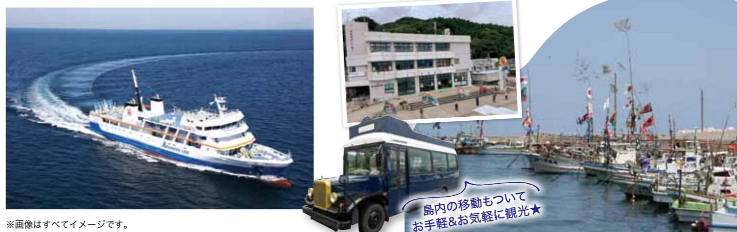
※画像はすべてイメージです。